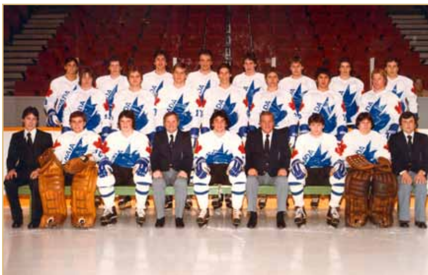
Championnat mondial junior de 1979