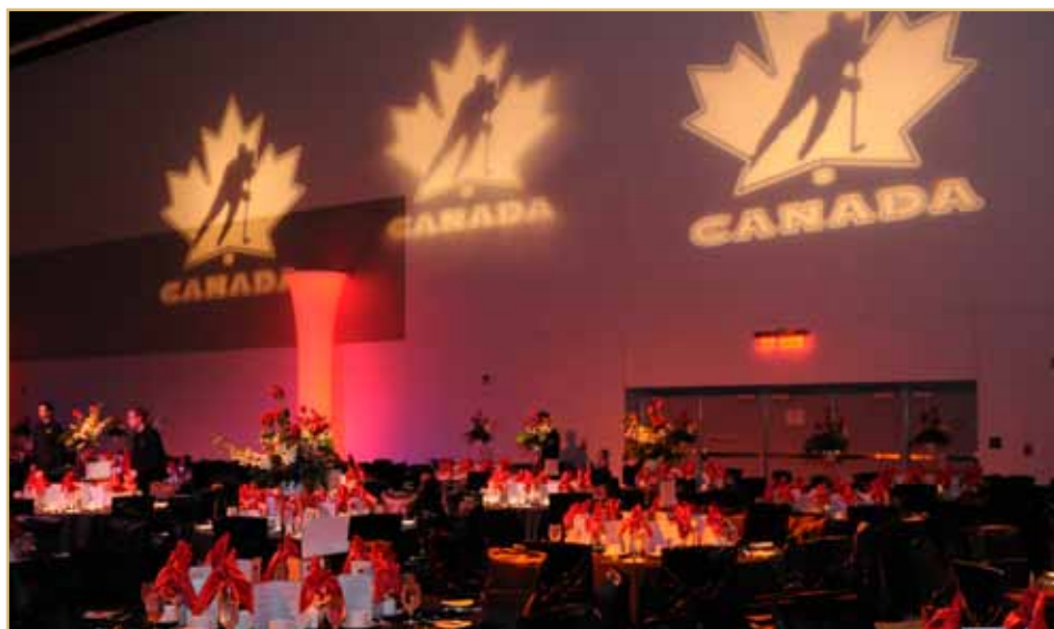
Gala et tournoi de golf 2011 de la FHC - Centre des congrès d'Ottawa, ON

C'est une histoire partagée par plusieurs anciens d'Équipe Canada. Une passion du hockey nourrie par des souvenirs d'enfance des heures passées à la patinoire extérieure durant les journées froides d'hiver, jouant à s'engourdir les orteils, jusqu'au coucher du soleil.