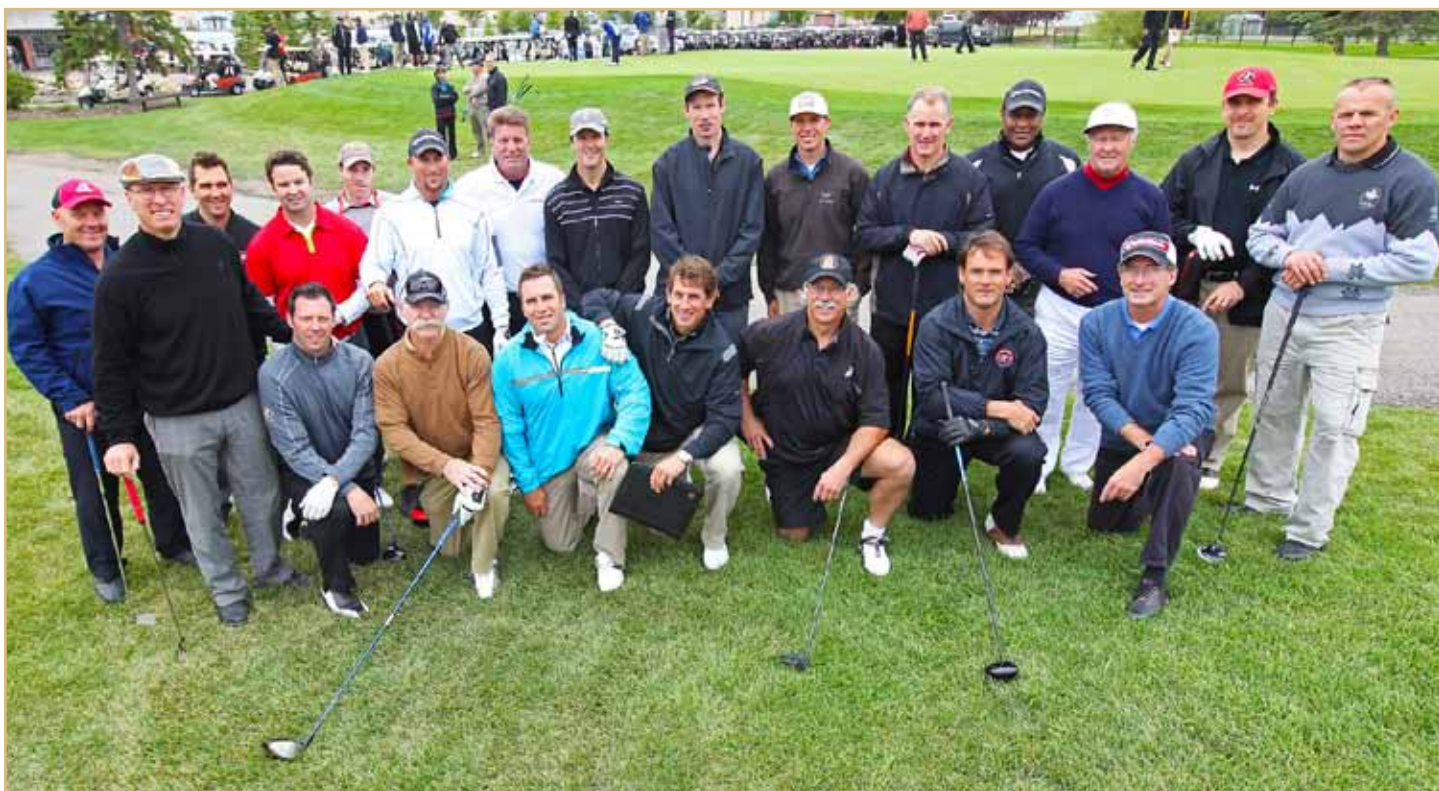
Tournoi de golf de charité de l'Association des anciens d'Équipe Canada - Lakeside Greens, Chestermere, Alb.

Nous savons qu'ils sont bons sur la glace, mais il semble qu'environ 24 anciens joueurs d'Équipe Canada se débrouillent aussi bien sur les verts. En fait, eux et leurs partenaires ont aidé à amasser environ 23 000 $ au 2e tournoi de golf annuel de charité de l'Association des anciens d'Équipe Canada. Cet argent s'ajoutera au soutien financier au hockey local et de haute performance partout au pays.