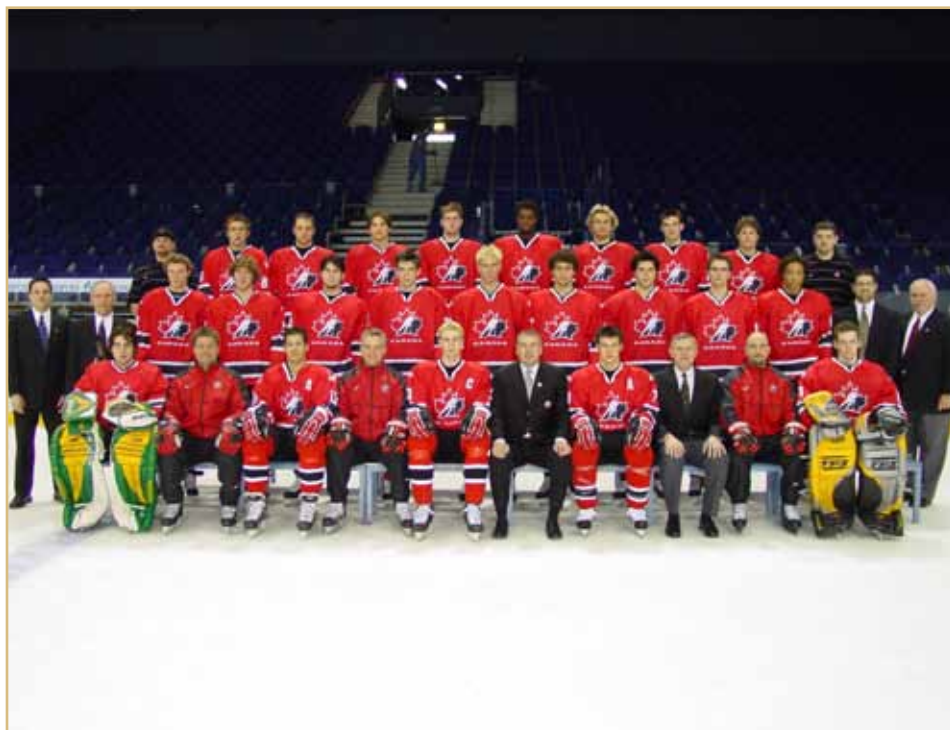
Championnat mondial des M18 de 2003