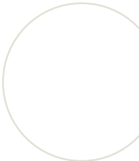
Tableau 3 : Bourses d'études de la LCH