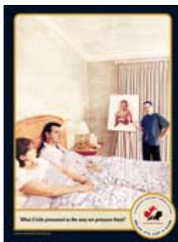
"Bedroom" Télécharger: Niveau bas Télécharger: Niveau haut Anglais seulement