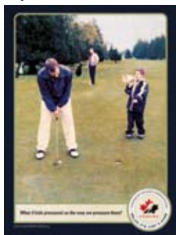
"Golf" Télécharger: Niveau Bas Anglais seulement