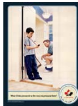
"Bathroom" Télécharger : Niveau bas Télécharger: Niveau haut Anglais seulement