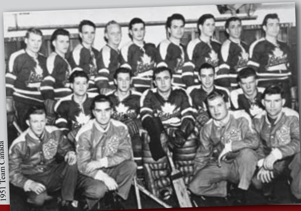
1951 Team Canada