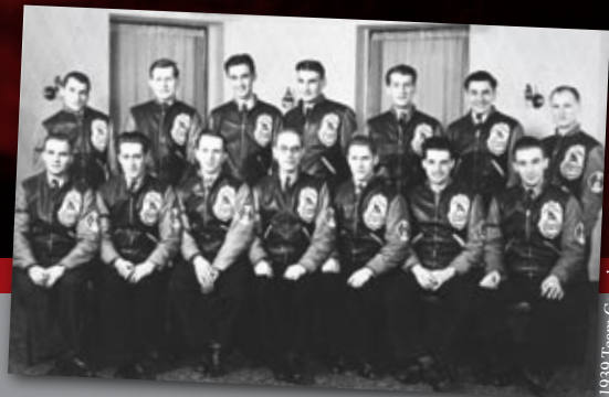
1939 Team Canada