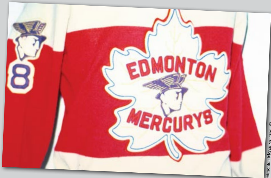
Edmonton Mercurys jersey #8