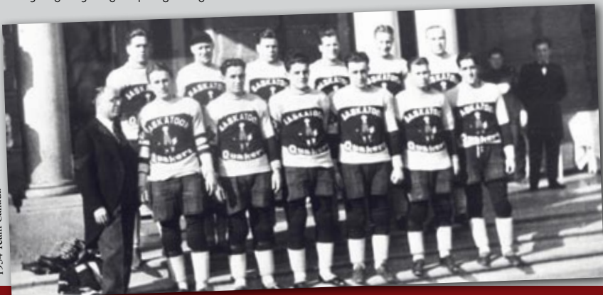
1934 Team Canada