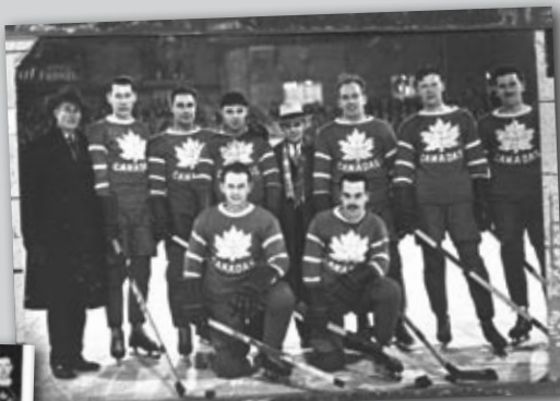
1930 Team Canada