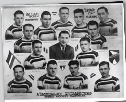
1937 Team Canada