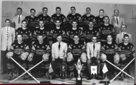
1958 Team Canada

En signe de protestation de la suppression de la révolution hongroise par les forces soviétiques, le Premier ministre canadien, Louis St-Laurent a refusé de permettre à une équipe canadienne de se rendre à Moscou pour prendre part au championnat mondial.