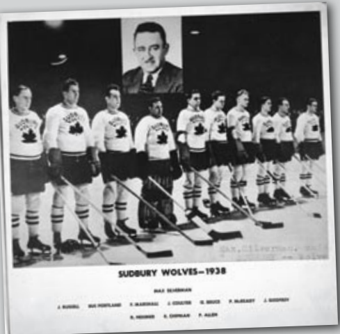
1938 Team Canada