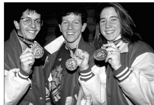
Danielle Goyette (left/gauche) Diane Michaud (centre/centre) Laura Schuler (right/droite)